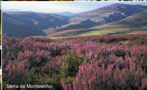
Serra de Montesinho