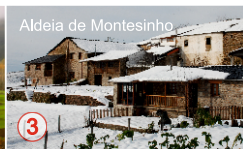
Aldeia de Montesinho