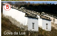
Cova da Lua