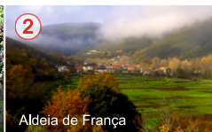
Aldeia de França