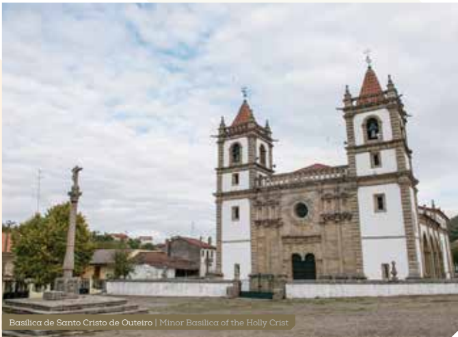
Basílica de Santo Cristo de Outeiro | Minor Basilica of the Holly Christ

Back in Outeiro, a more detailed visit to the village is recommended (Main Church, Minor Basilica of the Holly Christ of Outeiro, Pillory, former building of the Village Council and the Jail) and the Castle Ruins on the hill overlooking the village.