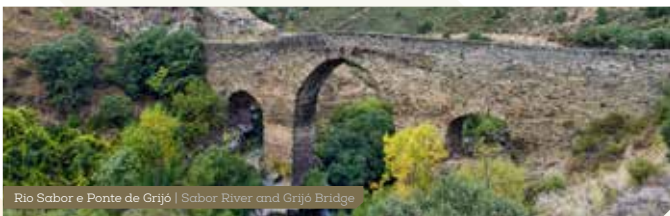
Rio Sabor e Ponte de Grijó | Sabor River and Grijó Bridge

From the existing native vegetation, the Cork Oak ( Quercus suber ), the Juniper ( Juniperus oxycedrus var. lagunae ), and the Holm Oak ( Quercus rotundifolia ) stand out, surviving in the steepest and most inaccessible places, ideal for the nesting of rupicolous birds, like the Egyptian Vulture ( Neophron percnopterus ), the Golden Eagle and the Bonelli's Eagle or the Eagle Owl ( Bubo bubo ). On land, one of the main species referenced, the Iberian Wolf ( Canis lupus ), reproduces itself here. In the aquatic environment, the Pyrenean Desman, the Otter, and the "Panjorca" ( Rutilus arcasii ) are observable. This is also one of the places with the biggest diversity of freshwater bivalves.